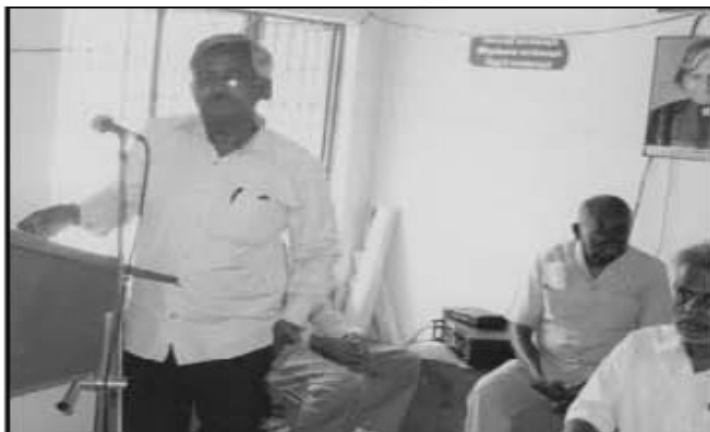
பொறியியல் பொ.பா.மேகன் கண்காணிப்புப் பொறியியல் அவர்களின் ஏற்புரை