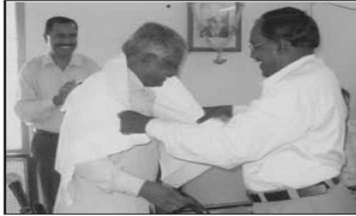
பொறியியல் பொ.பா.மேகன் கண்காணிப்புப் பொறியியலருக்கு பொறியியல் ஈன் ஆறுமுகம் தலைவர் சேலம் கிளை தமிழ்நாடு பொறியியல் சங்கம் அவர்கள் பொன்னாட ஆணிளித்தார்